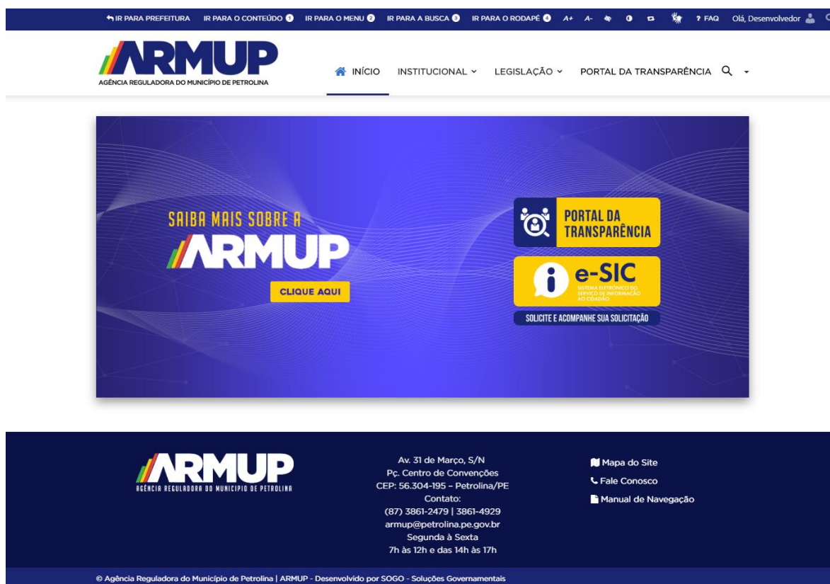
Figura 1 - Página inicial